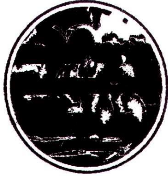
Aydın Memecik Zeytini