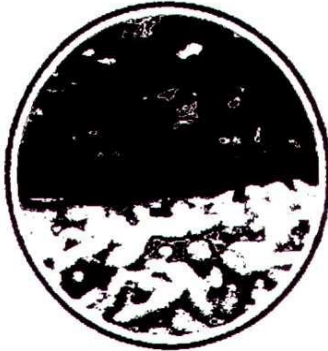
Aydın Çam Fıstığı