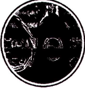
Aydın Memecik Zeytinyağı