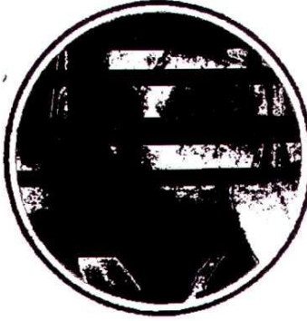
Aydın Yamalak Sarısı Zeytini